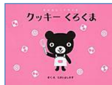
『クッキーくろくま』 (XE タカイ) くもん出版 たかい よしかず/さく・え