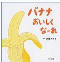
『バナナおいしくな-れ』 (XE ヤノ) 大日本図書 矢野 アケミ/さく