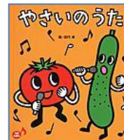
『やさいのうた』 (XE タシロ) フレーベル館 田代 卓/絵