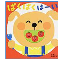
『ぱくぱくはーい!』 (XE アカイ) フレーベル館 あかいし ゆみ/作・絵