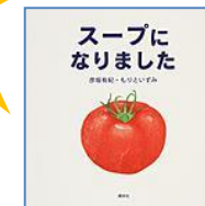
『スープになりました』 (XE ヒコサ) 講談社 彦坂 有紀・もりと いずみ/作