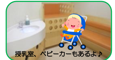
授乳室、ベビーカーもあるよ♪