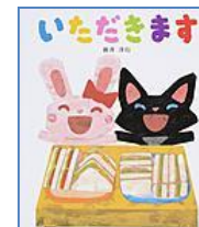
『いただきます』 (XE アライ) 童心社 新井 洋行/さく