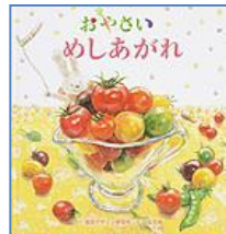
『おやさいめしあがれ』 (XE タカハ) 視覚デザイン研究所 視覚デザイン研究所/さく, 高原 美和/え