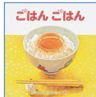
『ごはんごはん』 (XE ウチヤ) 視覚デザイン研究所 視覚デザイン研究所/さく, 内山 悠子/え