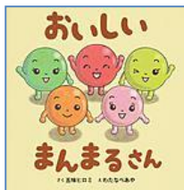
『おいしいまんまるさん』 (XE ワタナ) 岩崎書店 五味 ヒロミ/さく, わたなべ あや/え