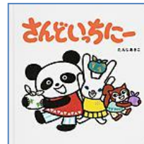
『さんどいちにー』 (XE タンジ) ほるぷ出版 たんじ あきこ/作