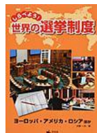
(写真は「ヨーロッパ・アメリカ・ロシアほか」)