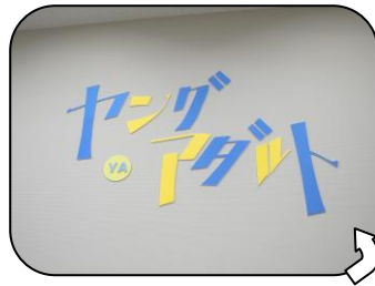
★YAコーナーに設置されているサイン★

「中高生対象の本を集めたYAコーナーをもっと利用してもらいたい！」という思いから中高生のメンバーを中心とした「ヤングアダルト応援隊！」を結成しました。同年代の目線から中高生にとって利用しやすいコーナーを図書館と一緒に考え、つくっていくことが活動の大きな目標です。一回目の活動は、そもそも「YAって何？」という話からはじまり、「じゃあ場所を知ってもらうために目立つ看板でもつくる！？」という結論に達し、大きな案内看板を作って掲示しました。遠くからでもばっちりYAコーナーがわかります！